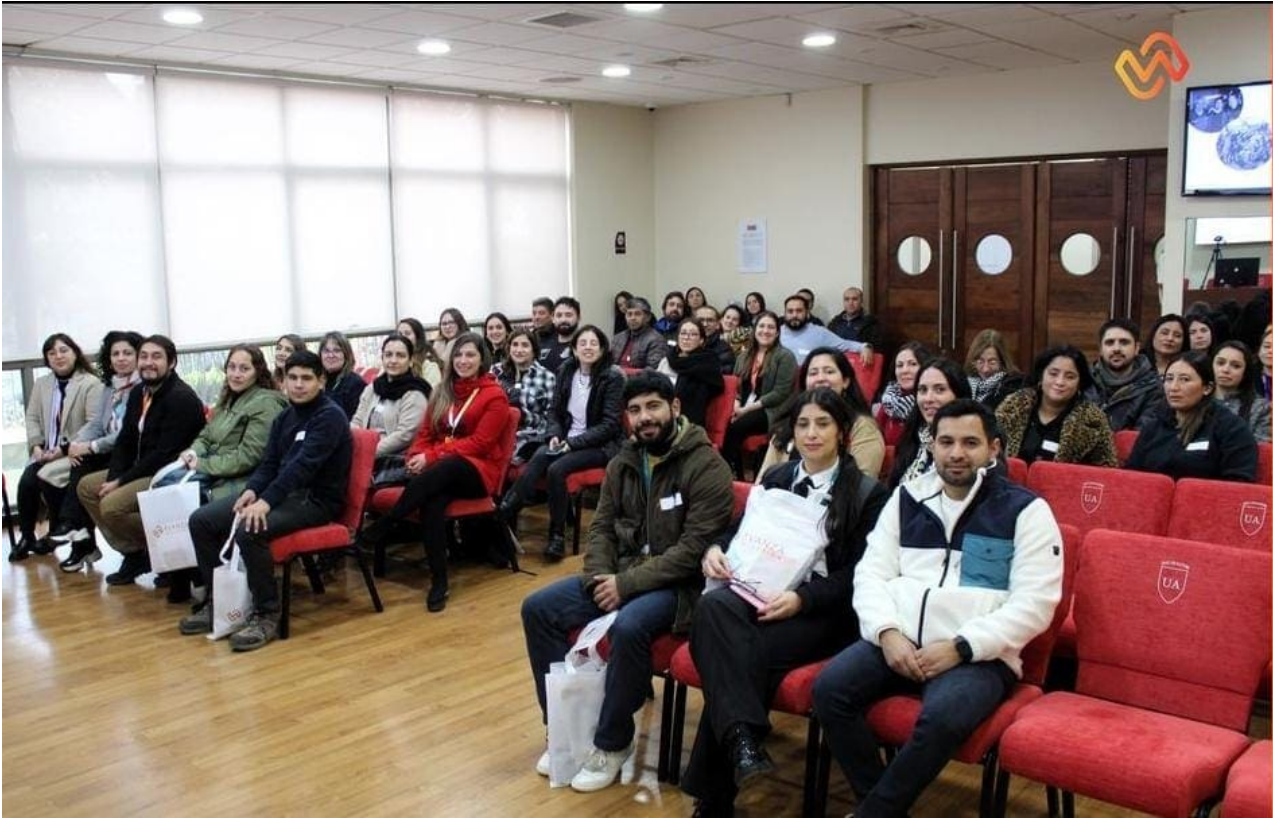
Taller apresto laboral Buin