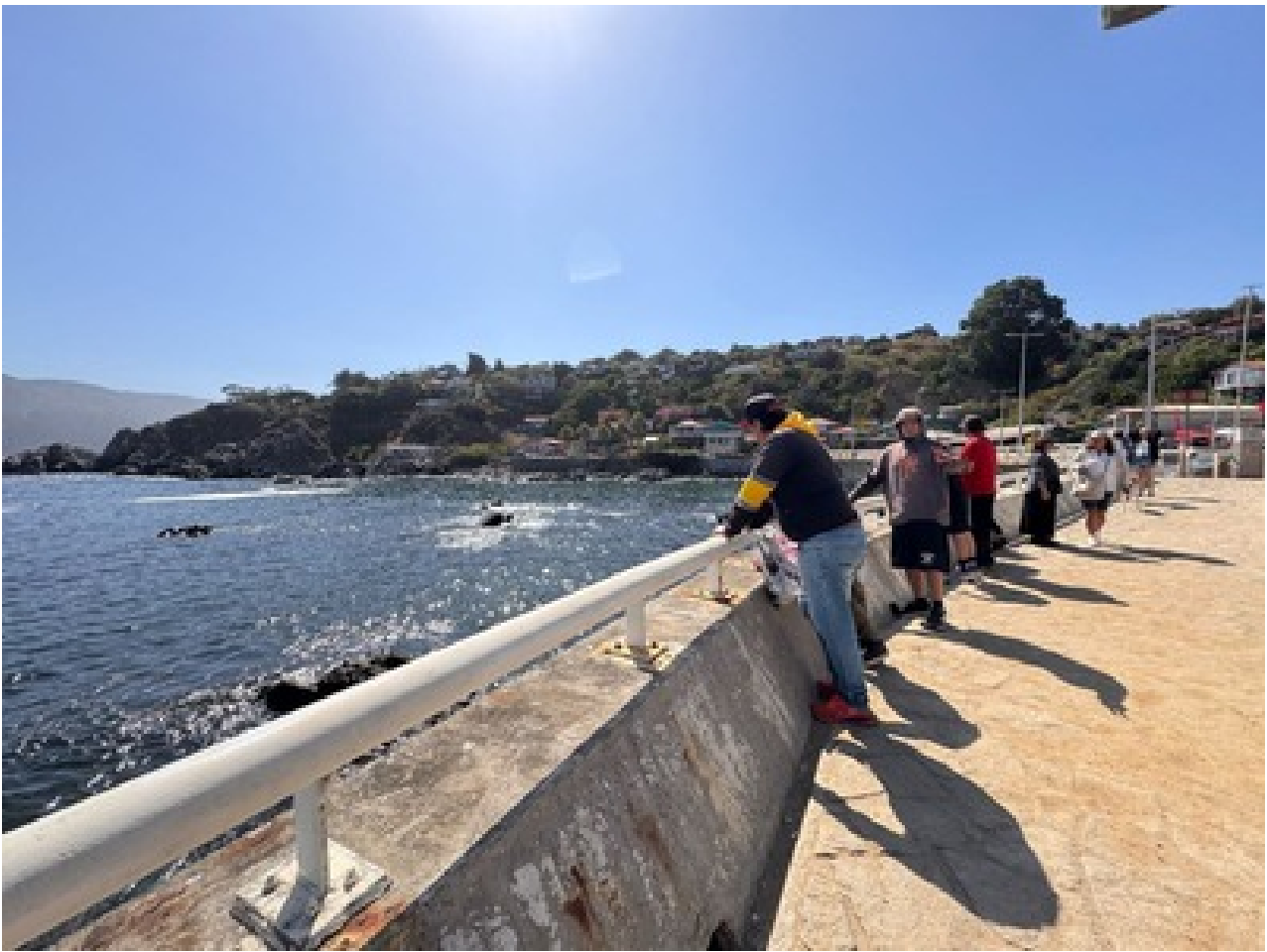
Taller de prevención de recaídas