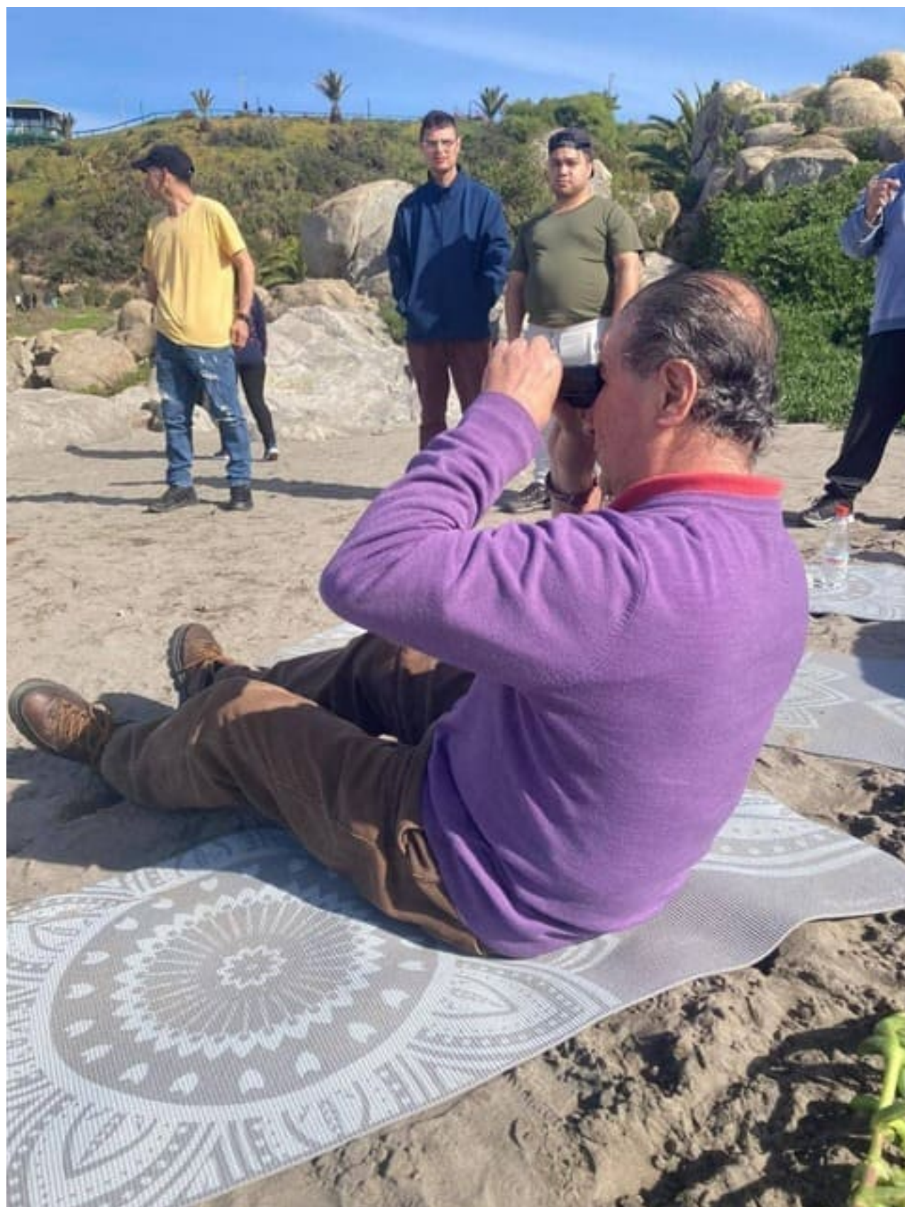
Taller de prevención de recaídas