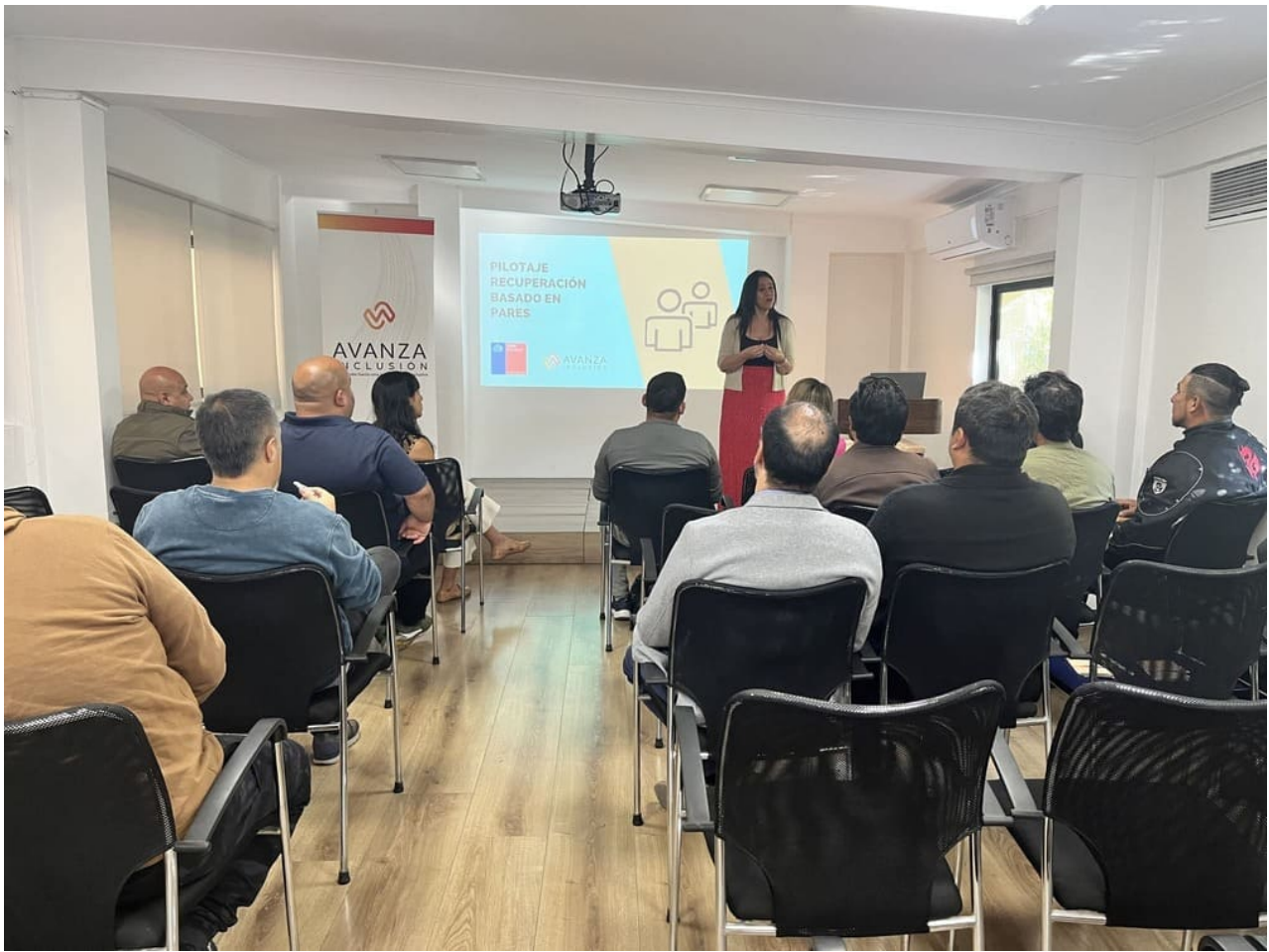
Certificación de formación R. Tarapacá