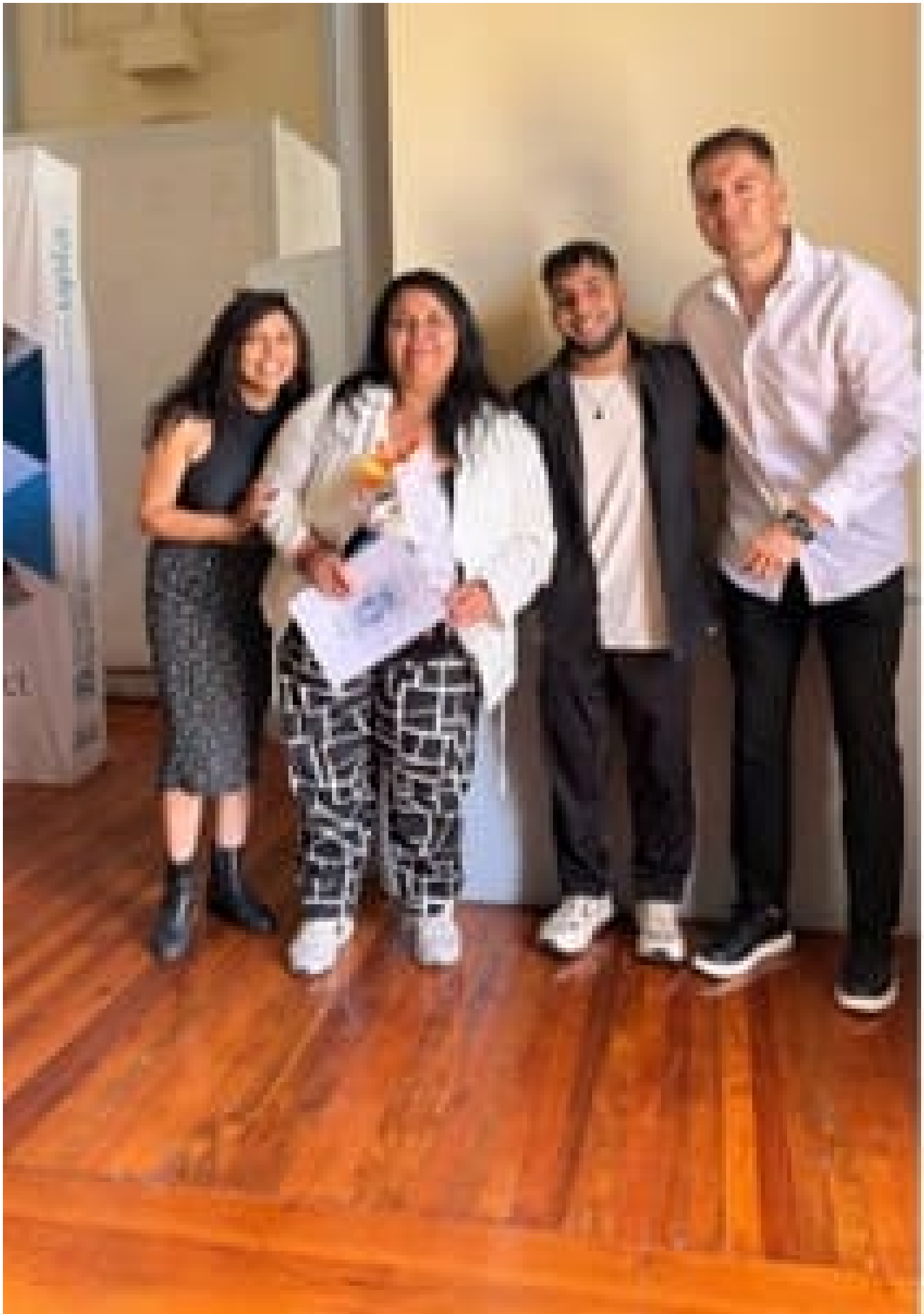
Espacio de convivencia