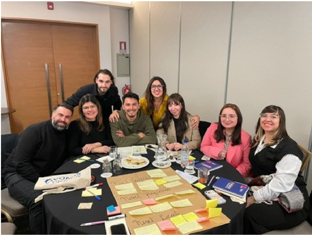
Actividades realizadas por el programa de Inclusión Social, como parte del proyecto AVANZAMOS CONTIGO. Patrocinado por el Ministerio de Desarrollo Social y Familia. En el marco de la medida subsidiaria de la ley de Inclusión Laboral.