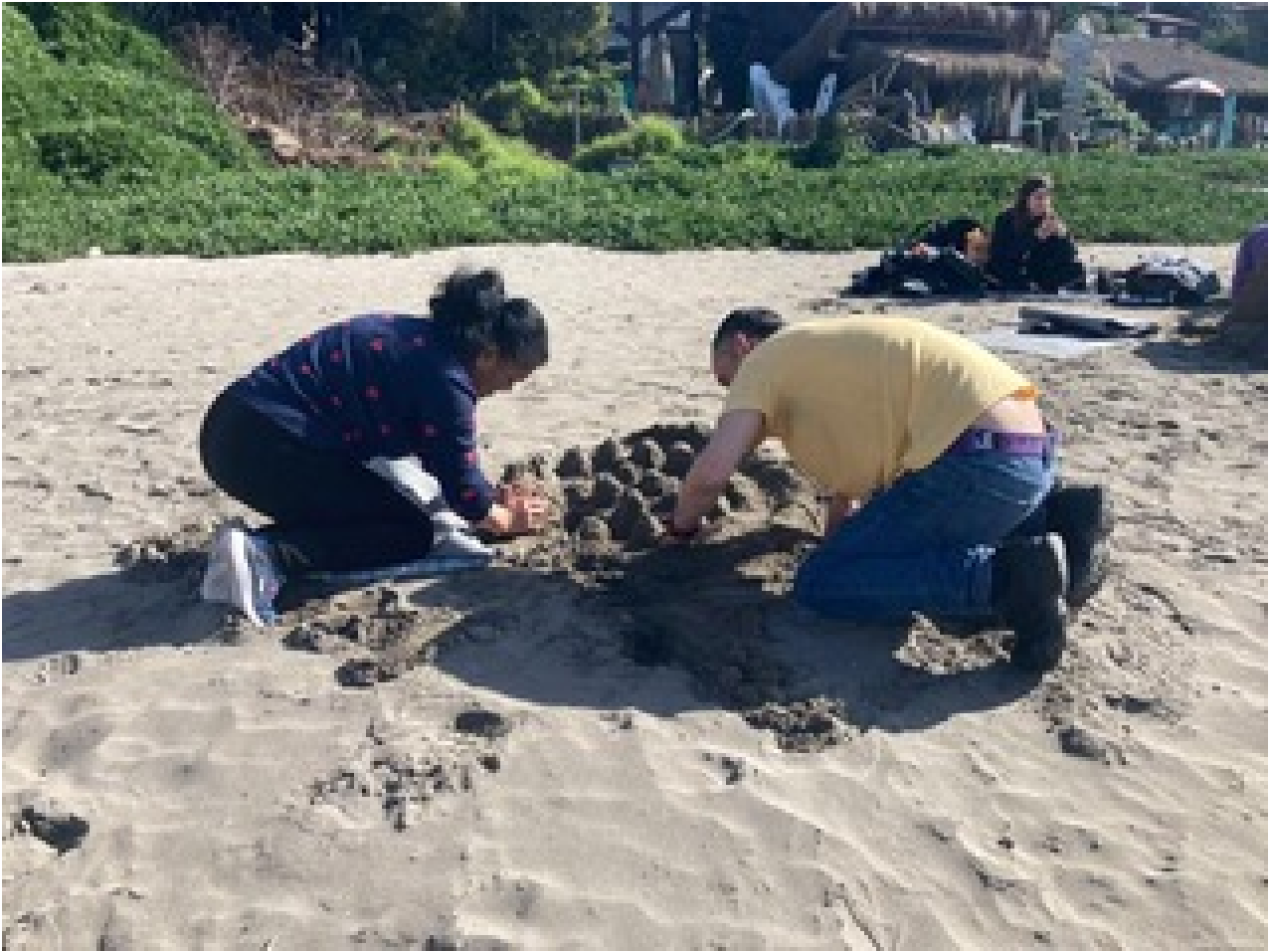
Actividad de vinculación con el medio