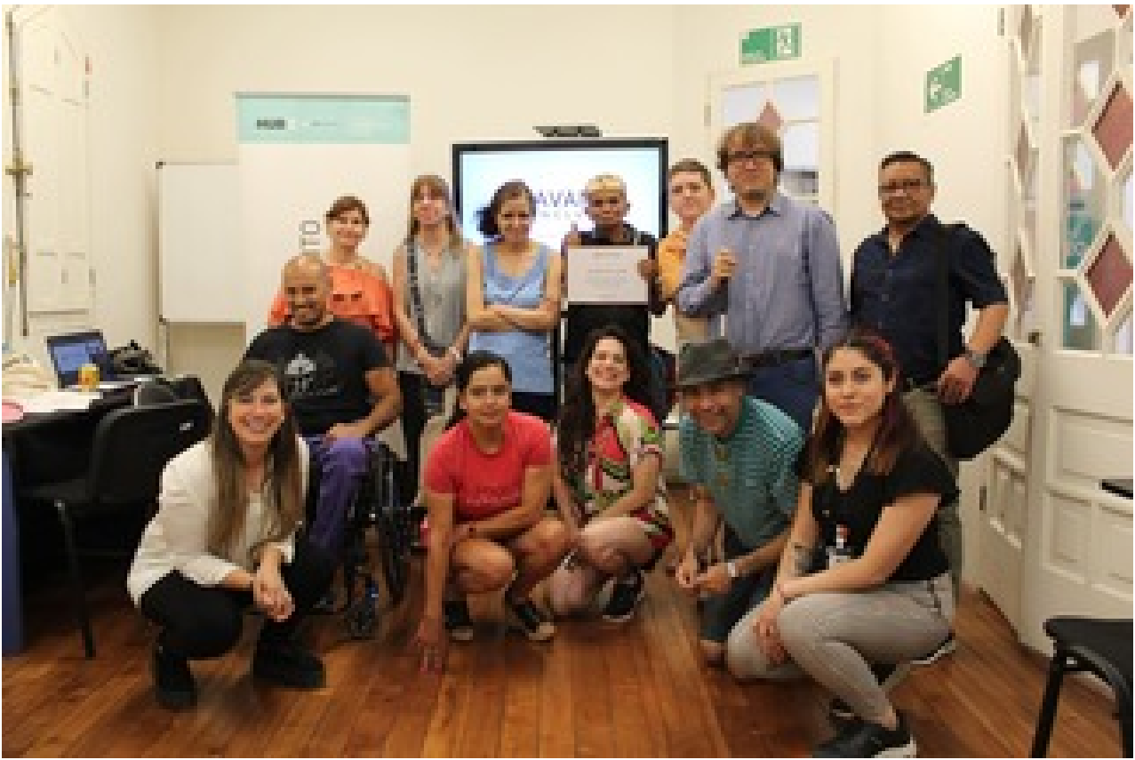
Taller de Outplacement