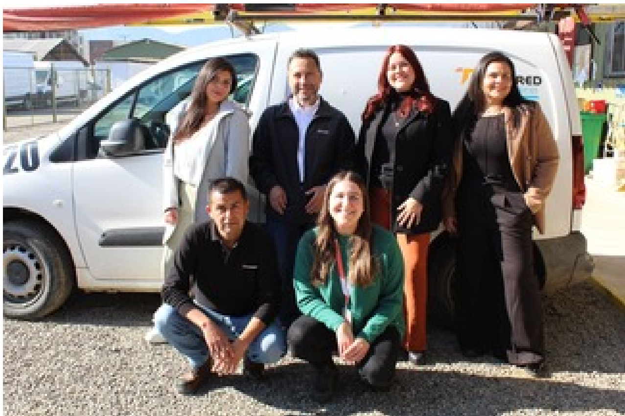
Taller de apresto Laboral