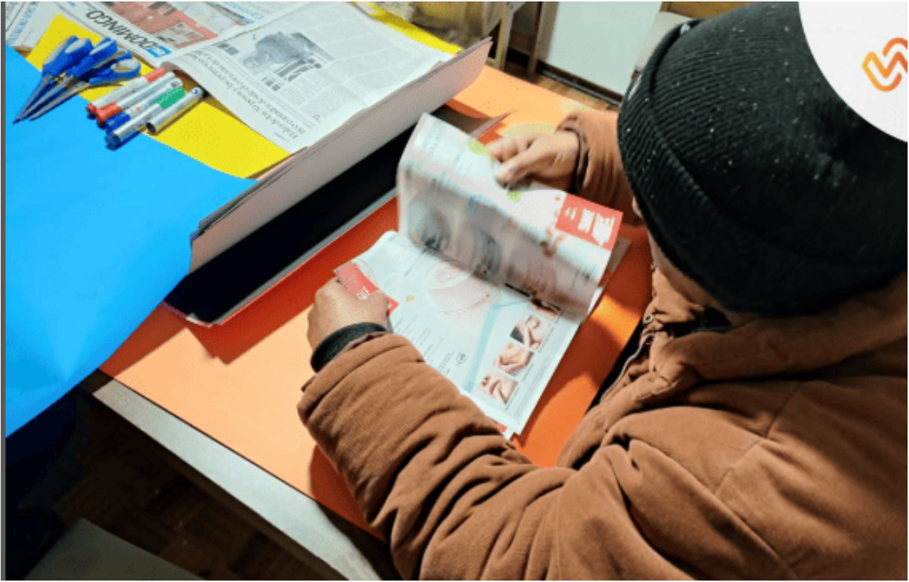
Salida a la comunidad