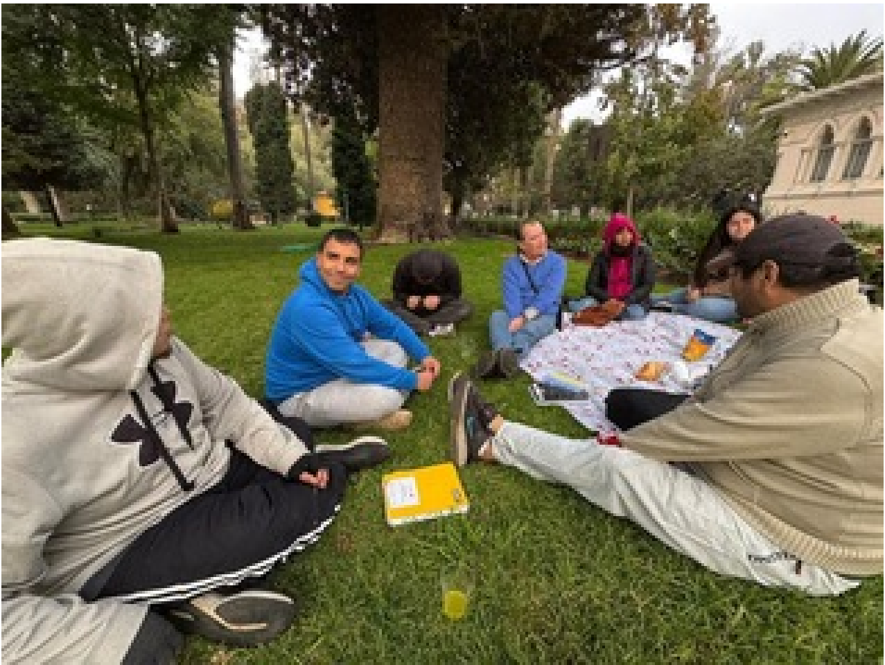
Actividad de vinculación con el medio