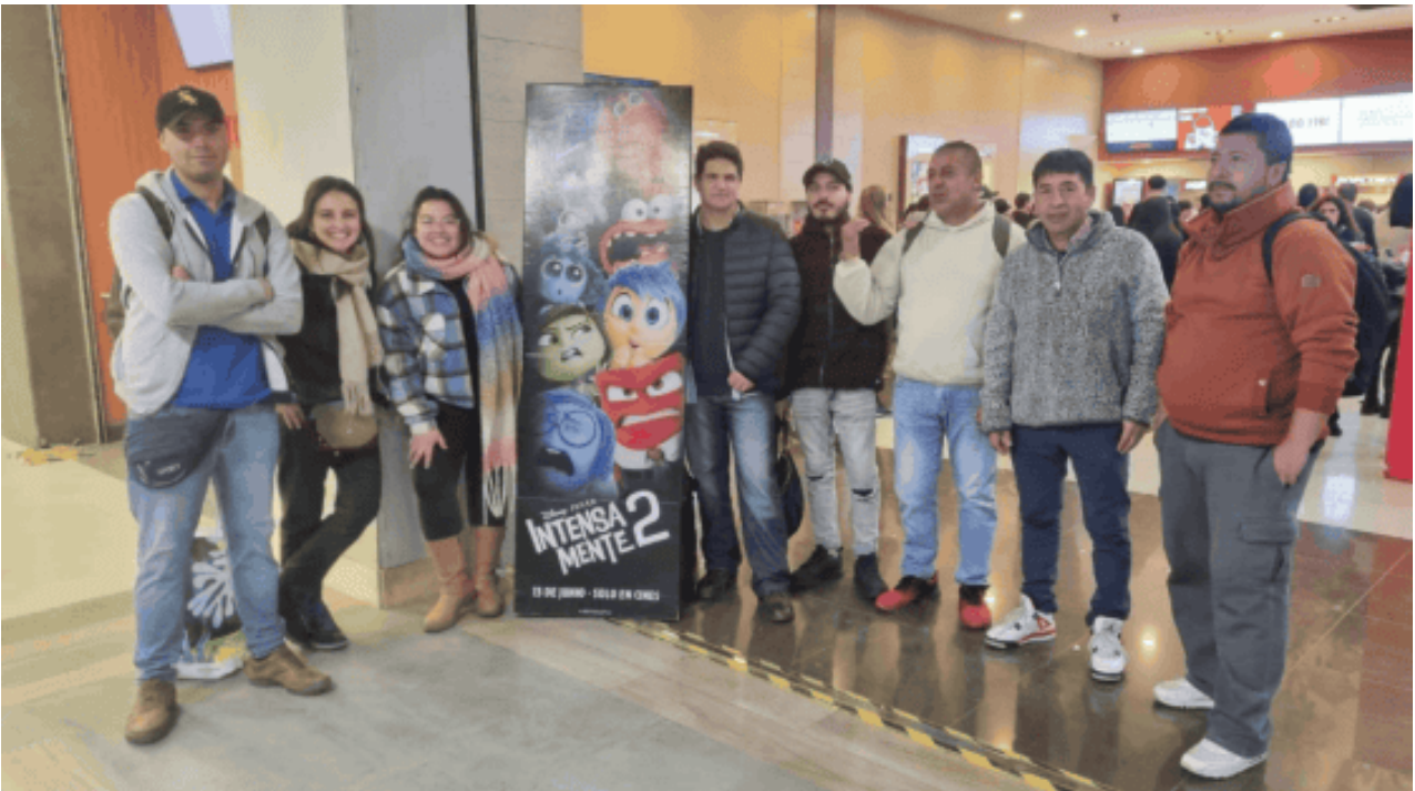
Taller de deporte