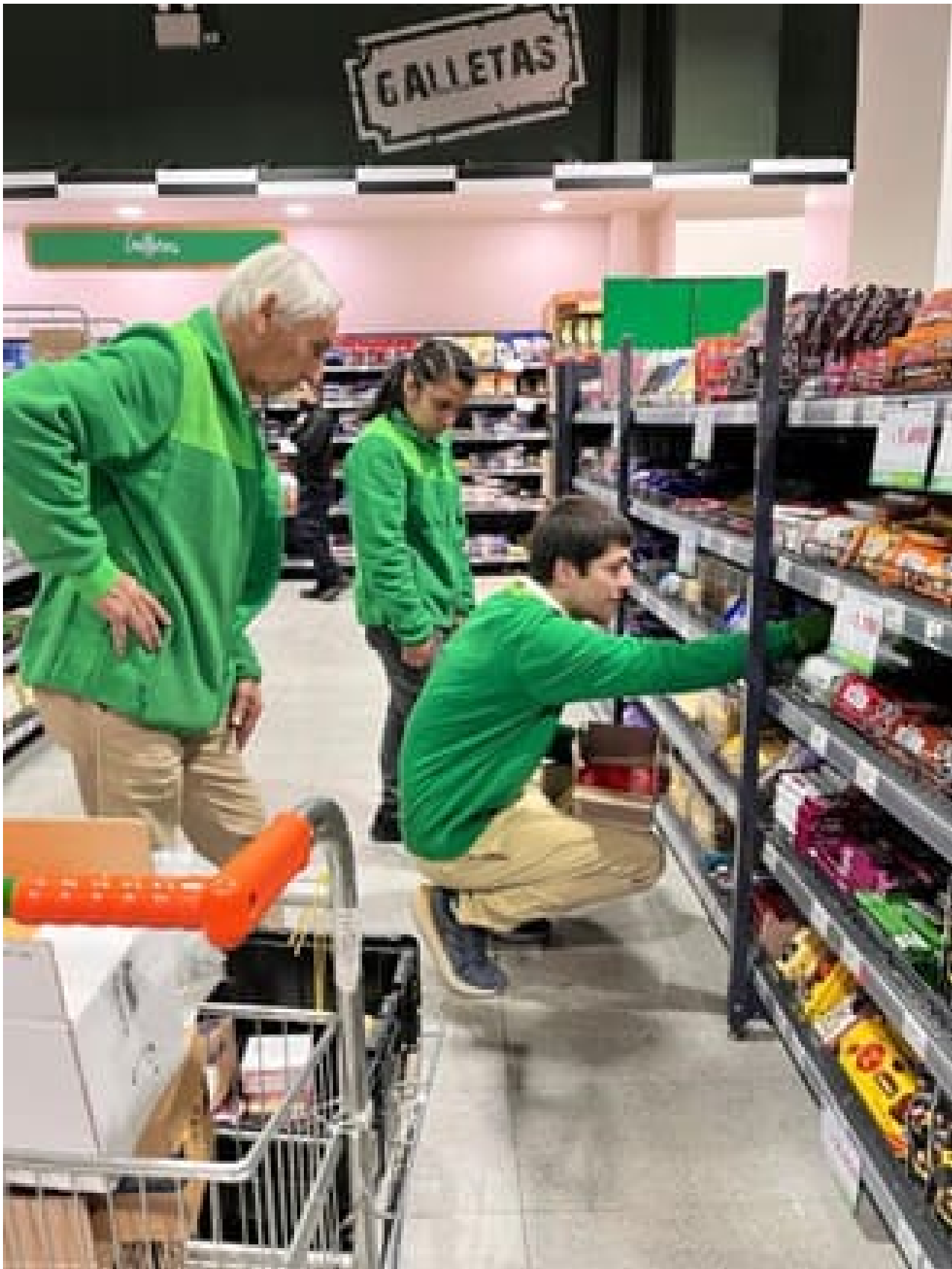
Taller de derecho Laboral