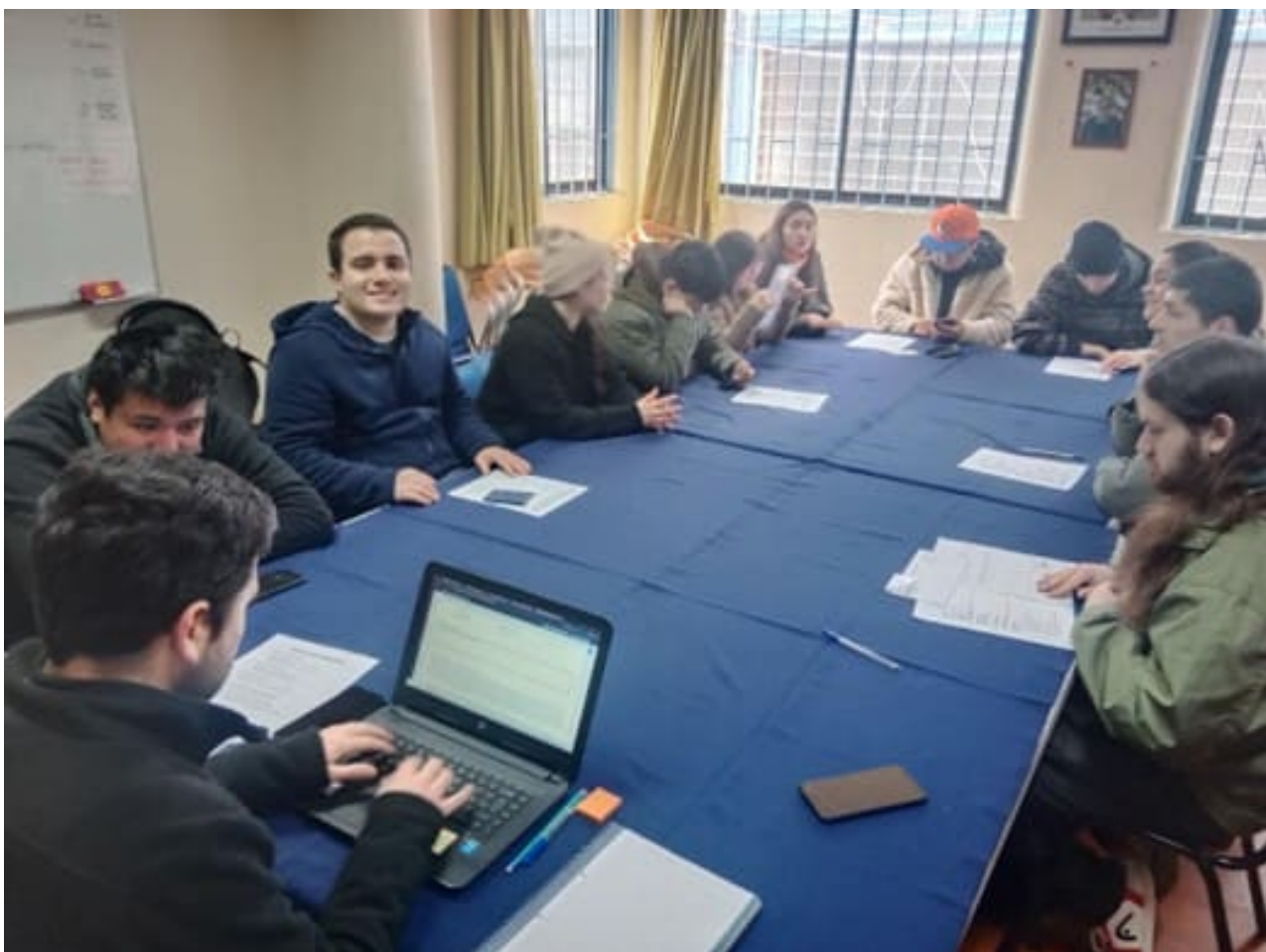
Práctica laboral en Jumbo