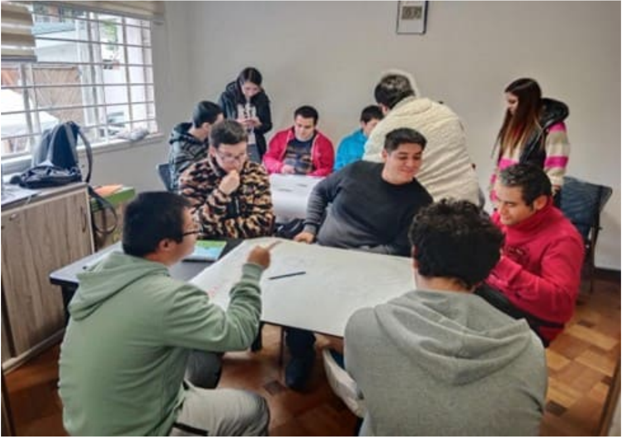
Actividad de cierre nacional de prácticas en COPEC