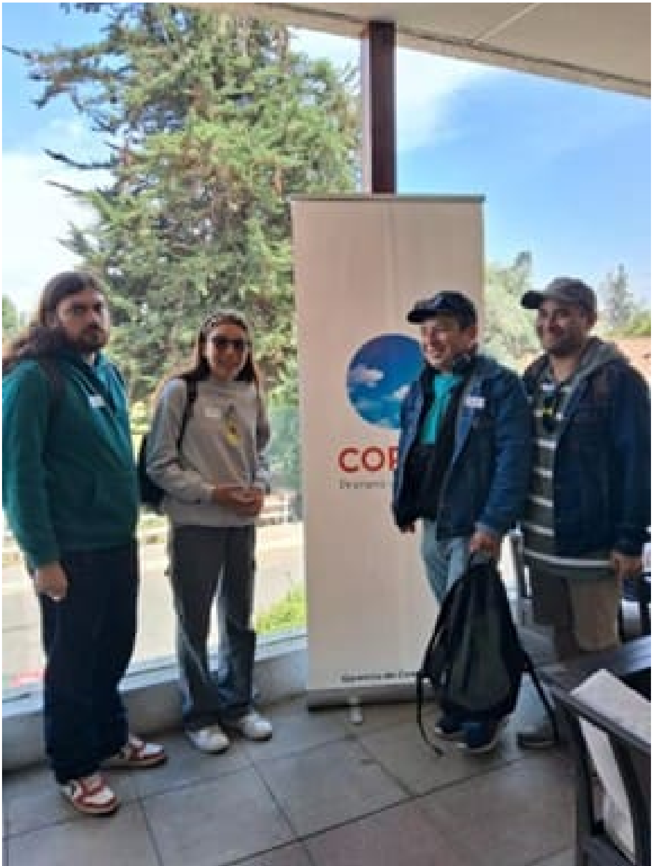
Focus group familiar