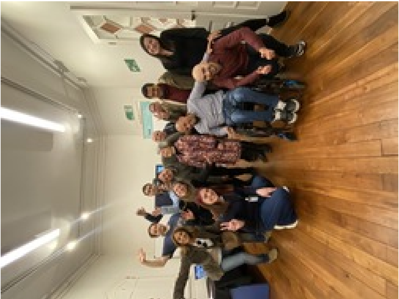
Workshop R. Maule