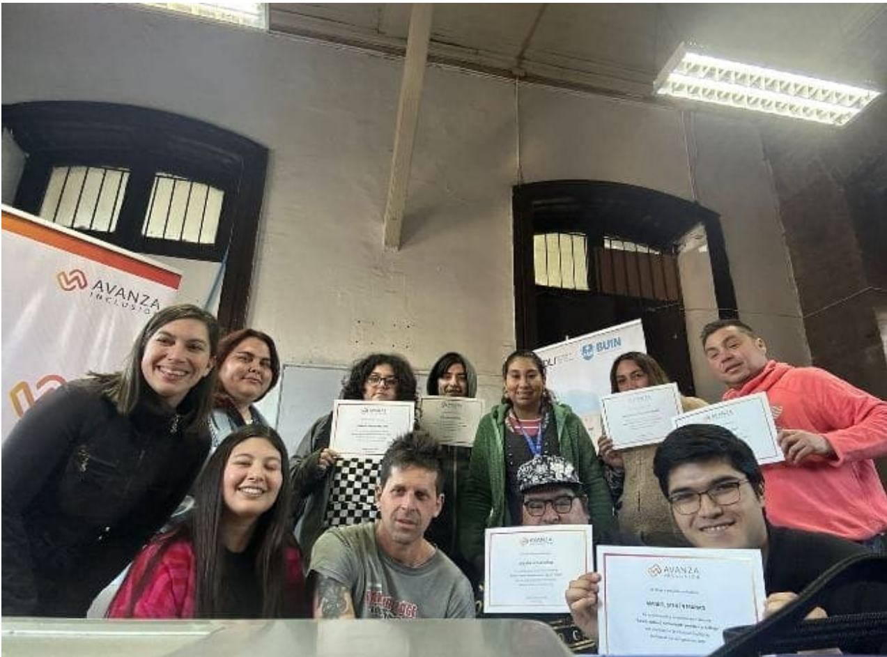
Charla de concientización Rhona