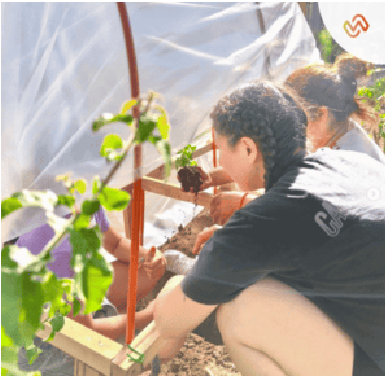
Arreglos en vivienda